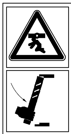
D.3 保养和维修作业前,锁定机械支撑机构